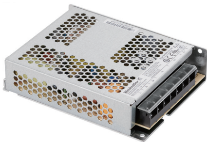
PRO PM 100W 12V 8.5A

広い動作温度範囲と広い入力電圧範囲 (AC/DC) を持ち、CE & CCC に適合するなど豊富なメリットを持つ PRO PM は、cURus などの規格も満たすコストメリットに優れたモデルです。