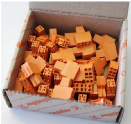
従来のバラ詰め梱包

バラ詰め梱包から、個々の製品をトレーに並べて梱包する方式に変更いたします。この変更により、従来発生していた輸送時などに梱包箱の中で製品同士が衝突することによるハウジングの破損を防止することが出来ます。また、製品はトレーに一定方向に並べられているため作業性にも優れています。