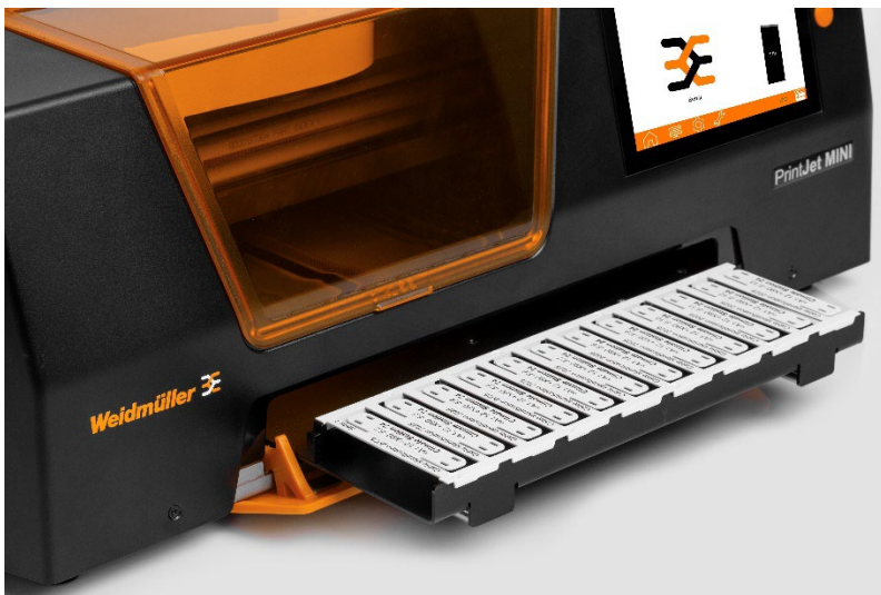
Bildunterschrift: Der kompakte Industriedrucker ist für unterschiedliche Anforderungen geeignet und kann verschiedene Materialtypen beschriften, egal ob ganze und halbe MultiCard-Karten, einzelne Segmente oder Markierer.