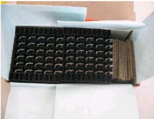
Abb.1: old packaging