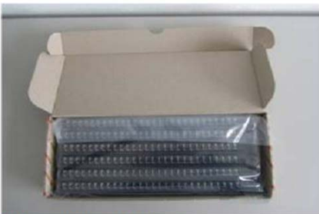
Abb.3: new vaccuumed packaging