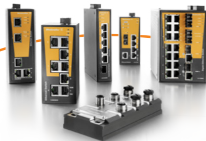
Managed und Unmanaged Switches