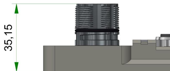
Abbildung 2: Höhe des M23 Sammelabgangs