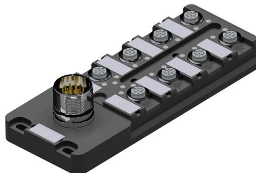
Abbildung 4: neues schwarzes Farbkonzept