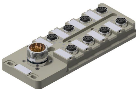
Abbildung 3: altes graues Farbkonzept