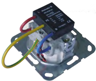
VPU III SO LD+A fény és hangjelzés cikkszám: 1351700000